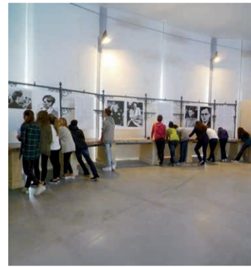
Exposition organisée par Weisse Rose Stiftung à Munich